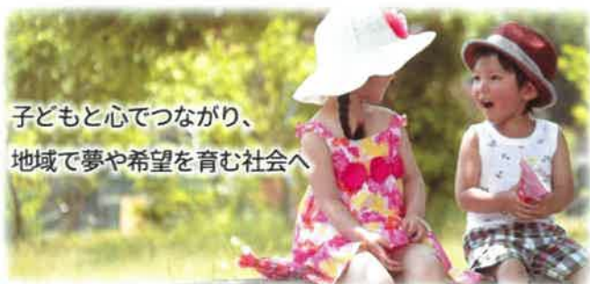
子どもと心でつながり、 地域で夢や希望を育む社会へ

そのためには、子どもの学びと育ちを 社会全体で支え、 地域で子どもたちが安心して暮らせるよう 新たな環境を創っていく必要があります。